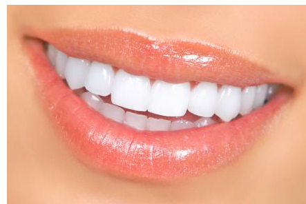
Power-Bleaching: Sichtbar hellere Zähne nach nur einer Stunde

Was kann man tun, wenn nur ein einzelner Zahn dunkel ist? Auf der nächsten Seite finden Sie Informationen zur Einzelzahn-Aufhellung!