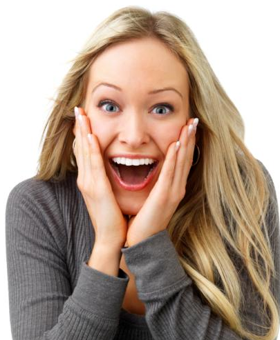
Power-Bleaching: Nicht zu fassen wie schnell die Zähne so hell werden