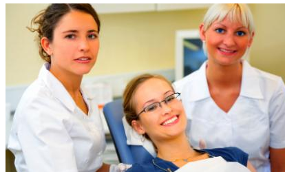
Regelmäßige Professionelle Zahnreinigung in der Praxis hält die Zähne hell und schützt vor Karies, Parodontose und Mundgeruch

Das hält nicht nur die Zähne länger hell. Es schützt sie auch vor Karies und Parodontose und es vermindert möglichen Mundgeruch .