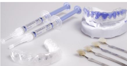
Trägerfolie (links unten) für das Bleaching-Gel (links oben)

Anschließend werden sogenannte Trägerfolien hergestellt. Das sind dünne flexible Folien aus Kunststoff, in die Sie später das Bleaching-Gel füllen.